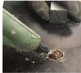
3 | Flüssige Füllstoff im Schaden verfüllen.