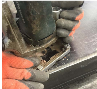
2 | Schadstelle mit der Oberfräse ausfräsen und mit Luft säubern.