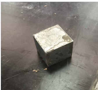
4 | Kühleisen oben zum Abkühlen und Einpressen des flüssigen Astfüllers im Schaden.