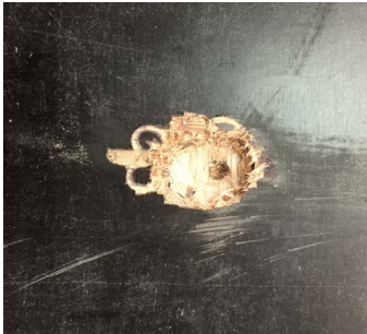
1 | Der Schaden wird entdeckt.