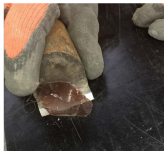
5 | Überschuss mit dem Hobel wegschneiden.